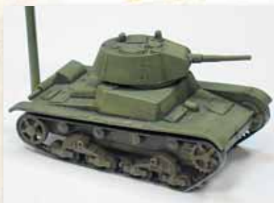
А так выглядит модель собранная «из коробки», без фар ночного боя.