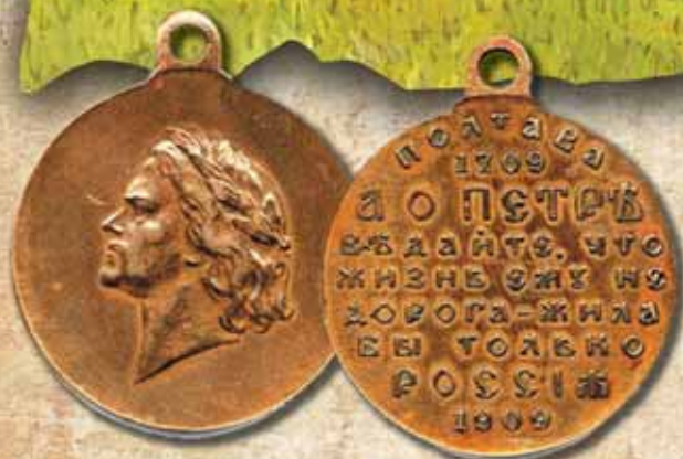
Памятная медаль 1909 г. в честь 200-летия победы при Полтаве.